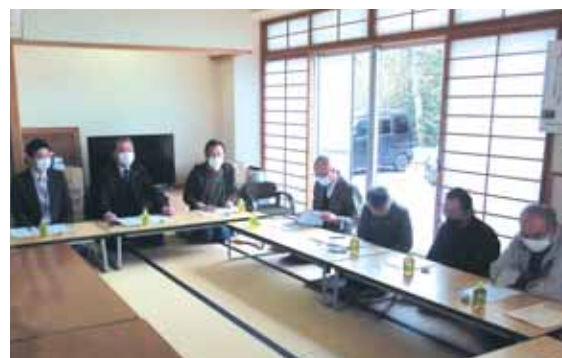
4/8(火) 大郷支部総代会の様子

4月5日(土)に新潟市南区の日の出町集会所にて「防犯パトロール出発式&パレード」が開催され、地域住民をはじめ白根高校ボランティアアクラブの生徒さん、日の出町お茶飲み会班のメンバー等、計60名が参加しました。 日の出町の「防犯パトロール隊」は平成17年に「みんなでつくろう安全と安心な地域」をスローガンにボランティアとして発足し、今年で20年目を迎えました。過去には長年の功績が認められて全国防犯協会連合会から防犯功労団体として受賞されたこともありまし