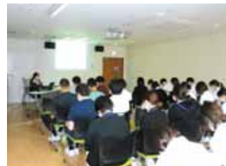
集合研修会の様子