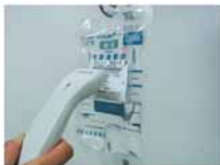
点滴バーコード読み取り