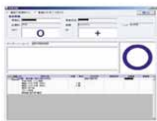
電子カルテによる認証