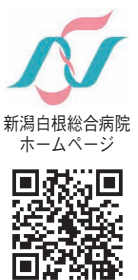
新潟白根総合病院 ホームページ