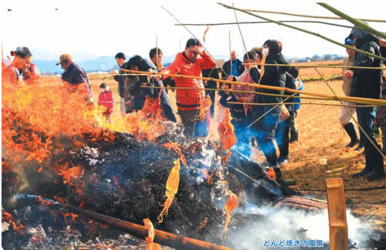
どんど焼きの風景